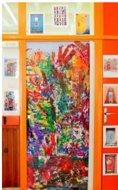
La porte de la classe décorée