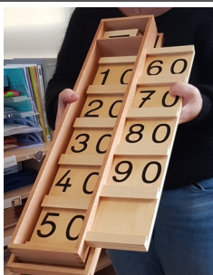
Table de Seguin