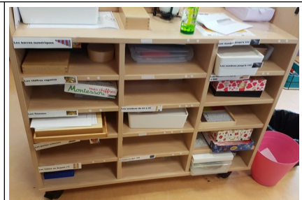
Boîtier cassette VHS pour jeux de lecture ou math