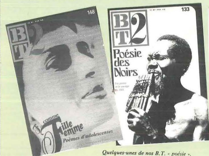
Quelques-unes de nos B.T. « poésie ».