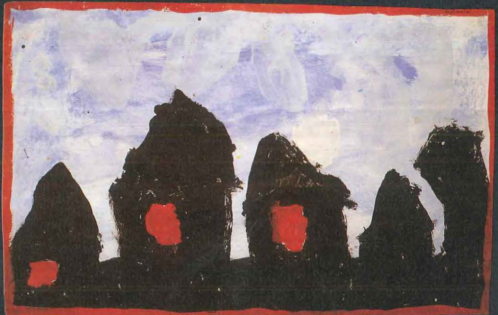
▼ Sylvain - 5 ans

Les enfants ont confronté aussi la nuit en photo et la nuit en peinture. De là est né un album.