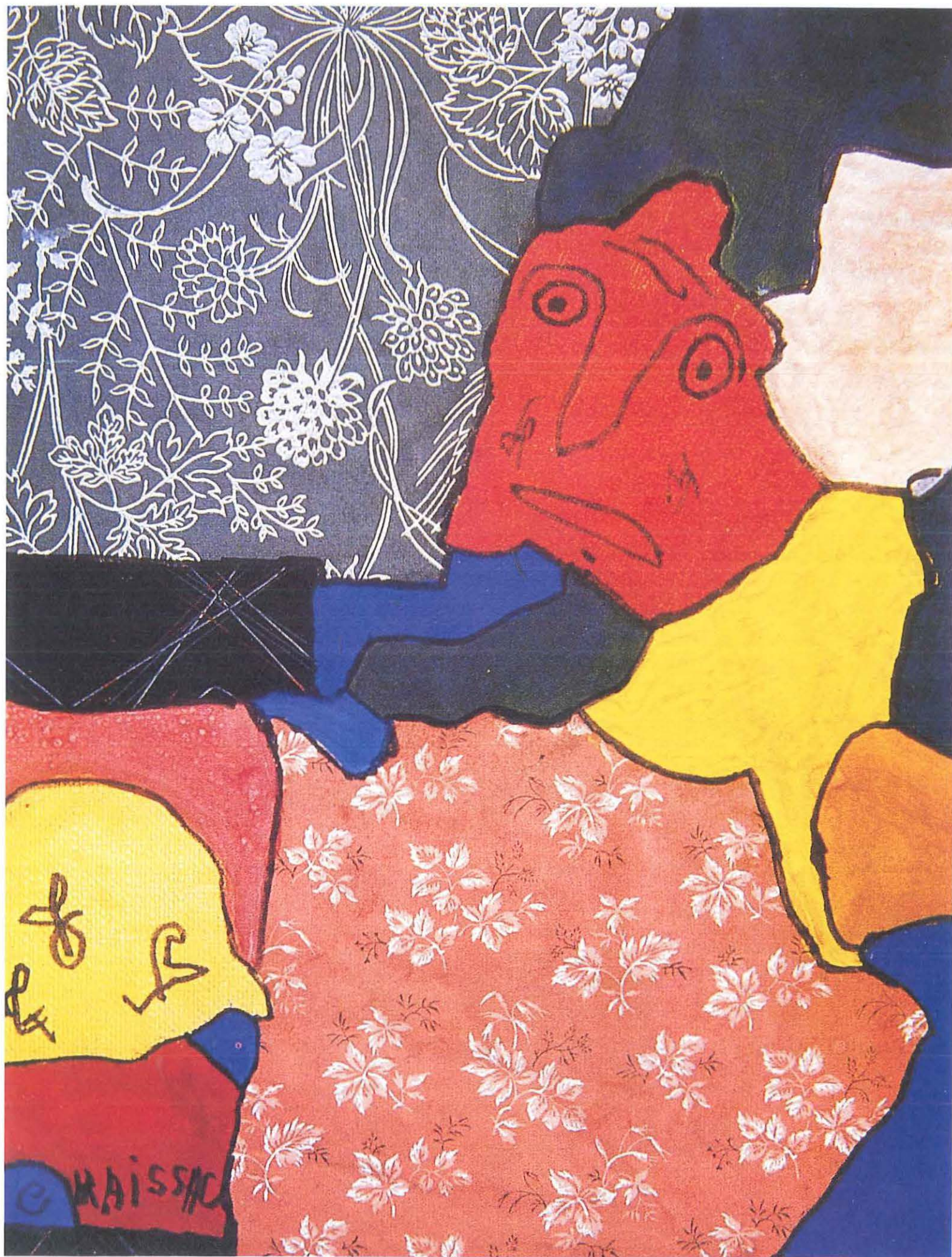
Visage rouge , 1962, gouache et collage de papiers peints sur papier - 64 x 50 cm, musée de l'Abbaye Sainte-Croix, Les Sables-d'Olonne.