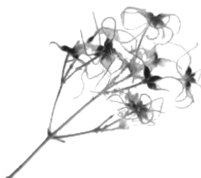
F - clématite