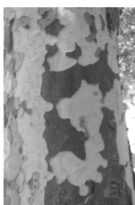
I - platane