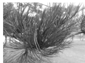
D - pin