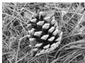
K - pin