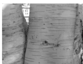
G - bouleau