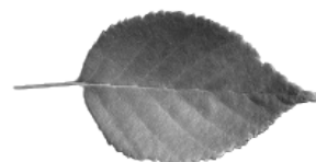
H - bouleau