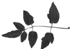
B - clématite