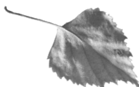
E - bouleau