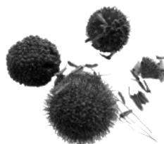
C - platane