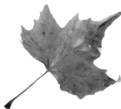
J - platane