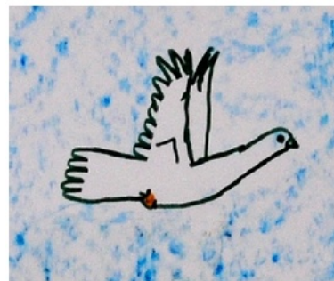
La colombe de la paix est un dessin de Picasso, réalisé en 1949.

Boris Vian , un poète écrivain, a écrit « le déserteur », une chanson pacifiste et antimilitariste qui fut interdite à sa sortie.