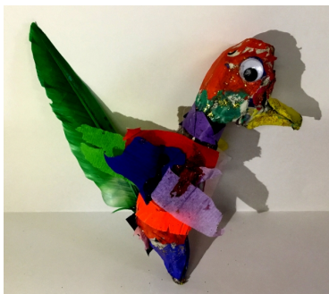
Revue CréAtions en ligne n° 263