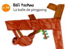
Couverture : Tris, École publique, Mirabilis et Bricons (26)