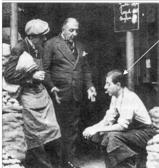
Jacques Prévert et son frère Pierre sur le tournage du film documentaire « Prix et profits » en 1932.