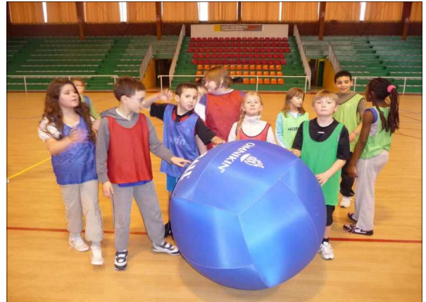
Notre classe lors des rencontres scolaires de kin-ball.