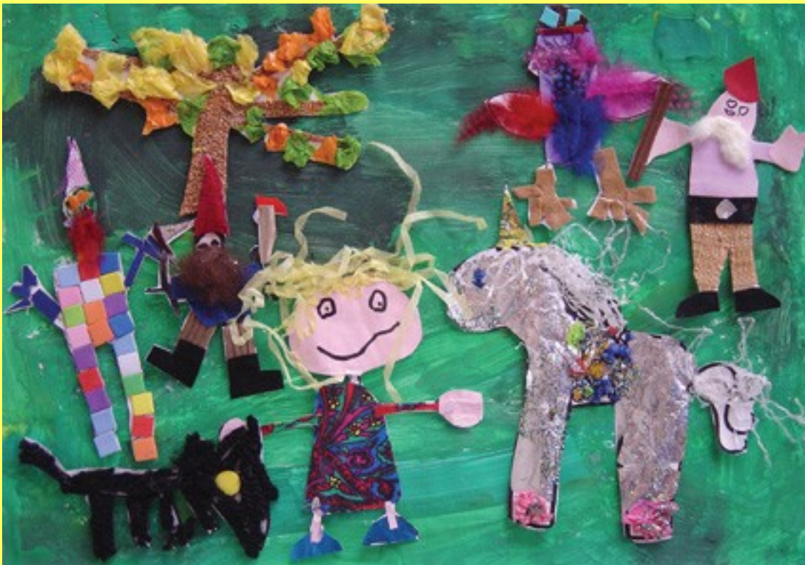
Poster publié (extrait de Marina et la petite sirène)

A partir de ce numéro 198 du Nouvel Educateur nouvellement paru (juin 2010), CréAtions vous propose une nouvelle formule avec huit pages en couleurs, comprenant: