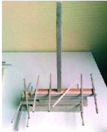
Kapla. Sans nom.

La production ne se fait pas par injonction du professeur, ce sont les élèves qui sont à l'origine de ce qu'ils font.