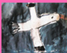
Les chats amoureux